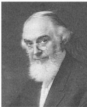
Charles Taze Russell ur. 1852 zm. 1916

C.T. Russell i współpracujący z nim badacze Biblii, przez cały czas swej działalności zapowiadali powrót łaski Bożej do Żydów. W wielu publikacjach i przemówieniach do wielotysięcznych zgromadzeń żydowskich, pastor Russell ogłaszał, że nastał Boski czas powrotu Izraela do ziemi Ojców. Był to zgodny z prorocstwami głos pociechy dla utrapionego karaniem Bożym narodu wybranego.